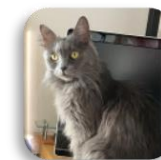
道端の猫じゃらし（イネ科）のお土産