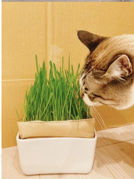
自宅で猫草（エンバク）の栽培